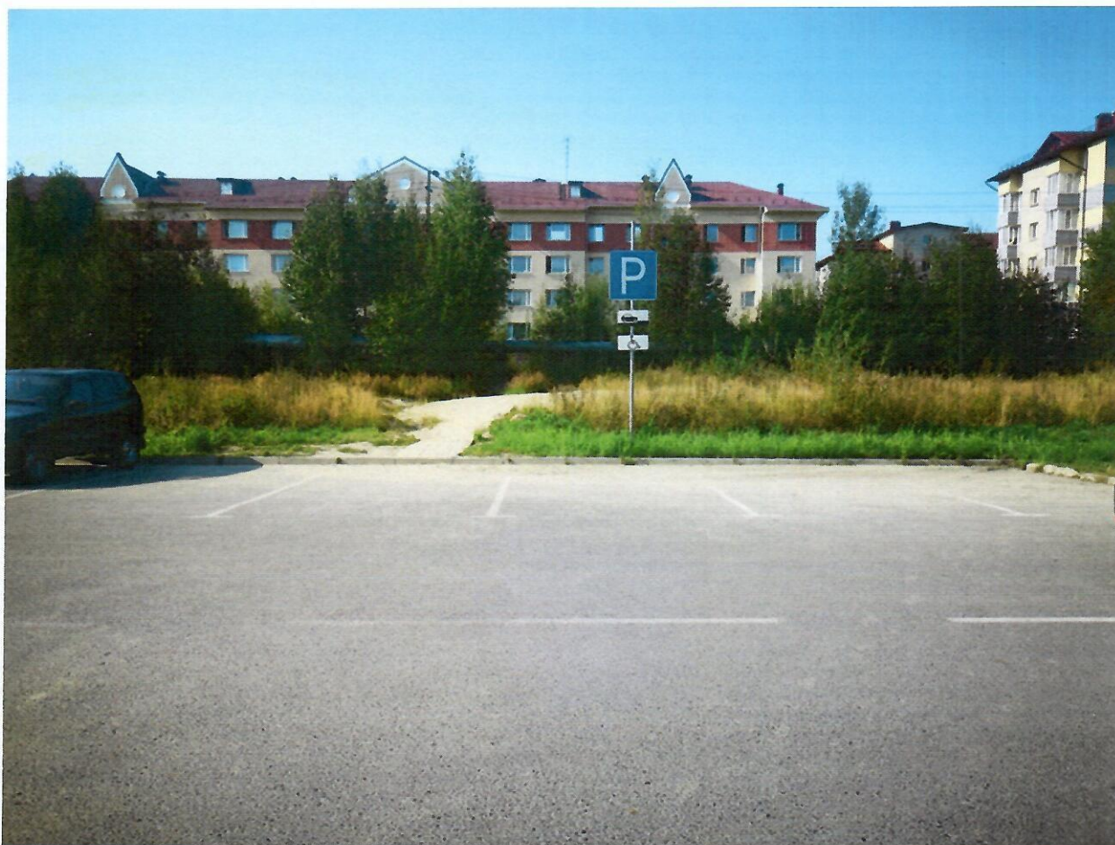
Автостоянка для инвалидов